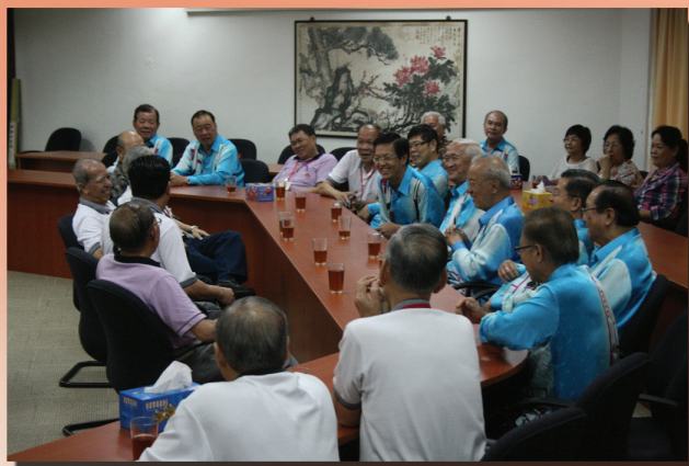
本亭与广东义山交流会