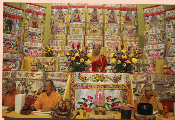
楞严精舍广荣法师僧坛