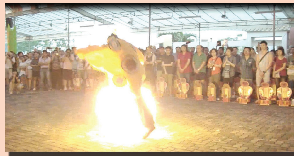
带幽魂过地狱火离地狱