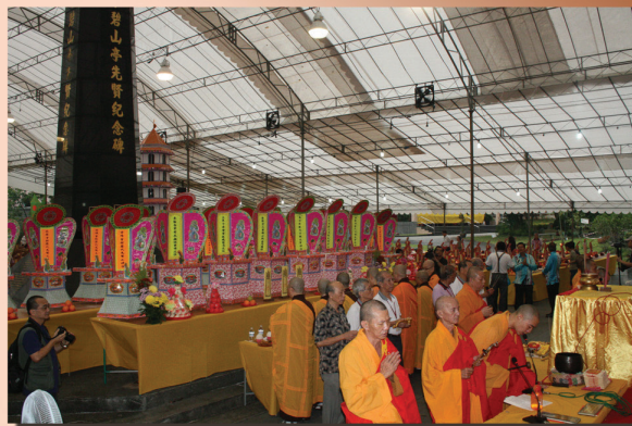
祭拜广惠肇三府及16会馆先人