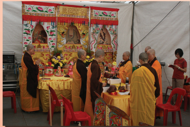
开意法师比丘尼地藏坛