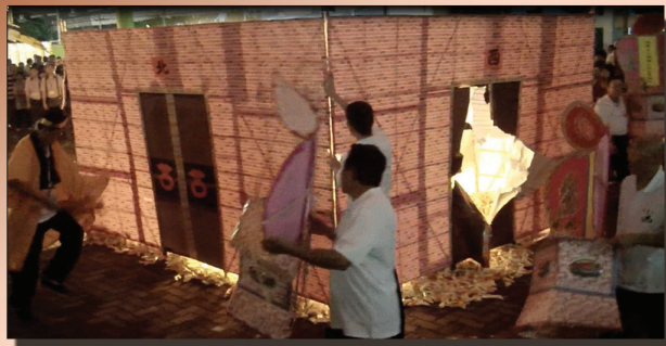
刘道长破九幽地狱