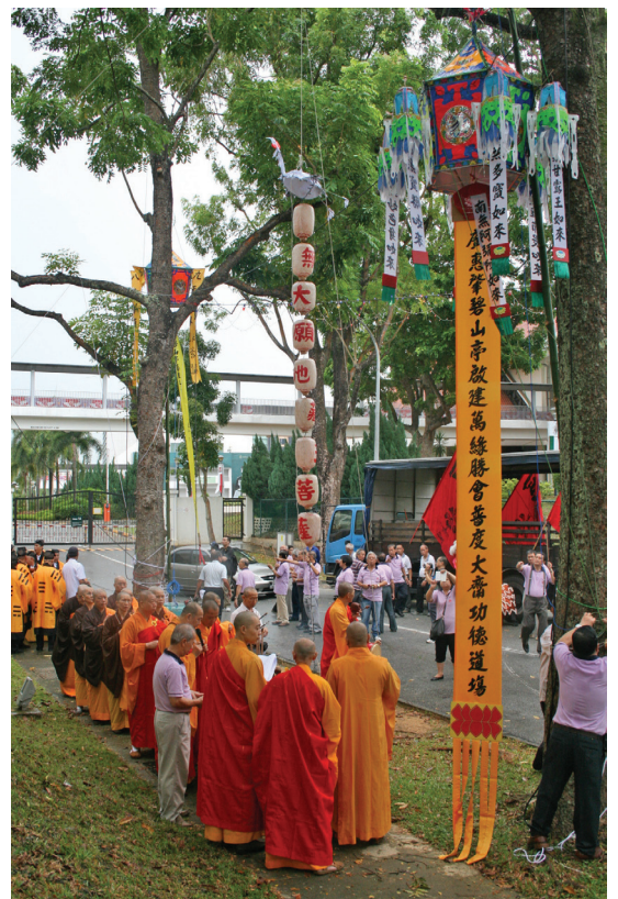
碧山亭正门牌楼前僧道两法坛竖幡掀开 2012年万缘胜会

从筹备到胜会功德圆满，本亭6常务、顾问、信托人及全体理监事、特别委员会与各组成员都各尽其责，不辞劳苦，真是功德无量！