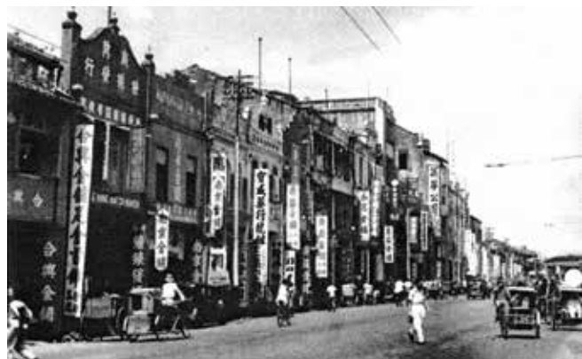
大马路的另一边多是金店，市面繁华