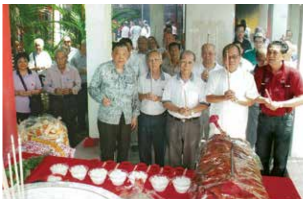
碧山亭同事于2013年清明节拜祭七君子