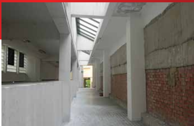
目前大牌02座的位置

大牌第02座的灵厅，已经批准拨款兴建全座新式骨灰埋牌位。工程正如火如荼筹划中，可能会聘请专业建筑设计顾问，提供市场最新设计并监督工程。待02座建成后，将大大提升碧山亭在这行业的社会品牌，发挥慎终追远精神。