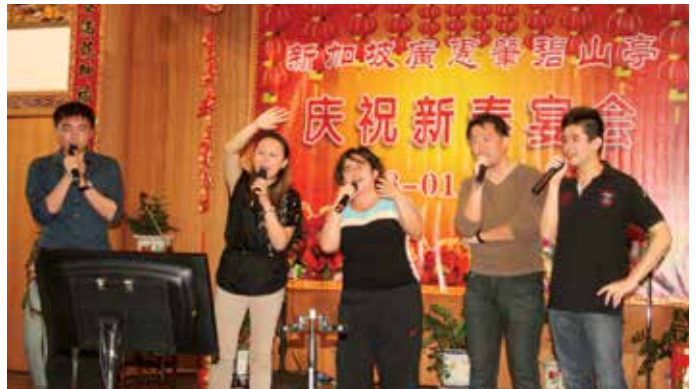
碧山亭青年团在团年宴合唱一曲《朋友》

本亭循例，向16会馆的70岁以上年长会员发送一年一度的贺岁金，今年红包总共89,040元，分发给1113位乡亲，包括三水会馆131位、惠州130位、冈州120位、东安119位、南顺90位、高要84位、番禺79位、宁阳66位、花县60位、恩平59位、清远51位、鹤山43位、增龙40位、肇庆25位、顺德12位，以及中山4位。根据一贯做法，有很多年长会员向自属会馆拿贺岁金，但只能向自己会馆或者向碧山亭拿，不可重复，因为这是乡团的一种敬老回馈，碧山亭也藉此回馈16会馆。