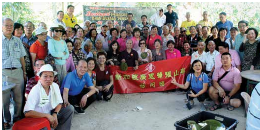
这些朋友都为榴槿而疯狂

略作休息后，两辆大巴开到麻坡的善财爷庙，又是参拜一番，有些同事还慷慨捐一点钱给善财华文小学和孤儿院，在庙前的小摊买些水果、蔬菜，也顺路走去小河边看看有没有海产到。傍晚，全体到新山市区的海鲜餐馆，加上烧乳猪，填饱肚子，约8点钟才满载而归。这次出游，唯一可以投诉的便是回程的交通大阻塞，排了一个多小时才进入新加坡关口。