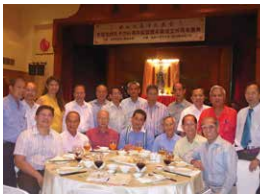
碧山亭同事出席孔教会庆典

本亭20位同事，出席去年10月南洋孔教会庆祝2564周年华诞。有机会与会长郭文龙和青年团团团长毛朝晖等负责人交换意见，进一步了解孔教会在弘扬儒家文化论坛系列的多个专题讲座，希望以后可以互相配合，带动碧山亭与16会馆继续推广“慎终追远”精神。孔教会还颁发第一届孝道奖，遴选新加坡最能表现孝道的家庭和个人，10位入选者有一位只是17岁的马来西亚学生和68岁的本地商人，当中还包括2名马来族与1名印度族同胞，颁奖礼全程由一位印度同胞以纯正的华语主持，完全体现了我国多元民族的容忍社会。孔教会今年正值100周岁，将举办世界性论坛，希望有机会组团去山东曲阜祭拜孔圣，碧山亭将会配合。