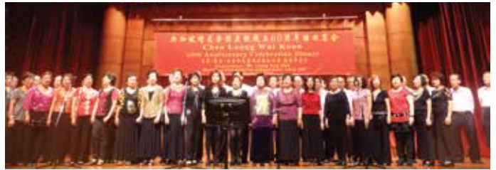
合唱团在增龙会馆60周年晚会大合唱