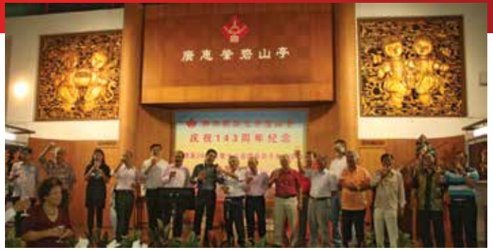
碧山亭领导向大家敬酒