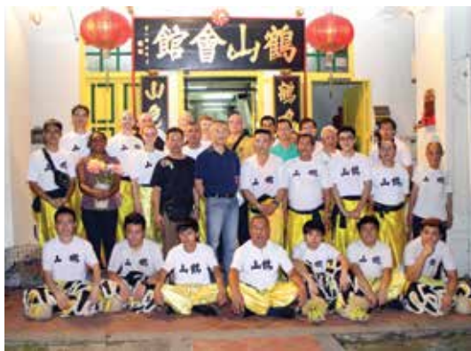
鹤山会馆舞狮和德国岭光高手合照

去年12月28日鹤山会馆再一次应旅游局邀请，在牛车水原貌馆面前和士敏街路边表演两场舞狮和武术。刚巧来自德国的岭光武术会拜访会馆，两位德国高手也就现场一同表演双匕和长棍。