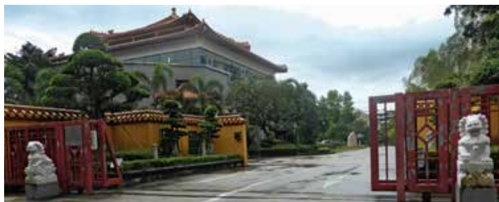
一对石狮和6棵榕树恭迎访客