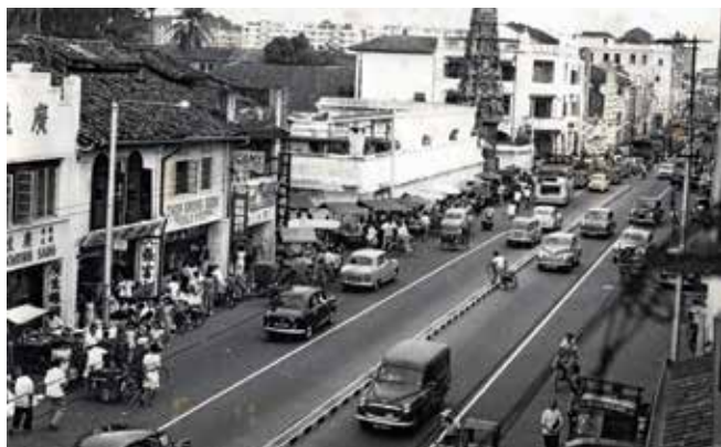
大马路（桥南路）的一边有Sri Mariamman Jamde 印度庙和Jamae 回教堂

大家相信，我国不只要吸引外国旅客到牛车水参观，更加要鼓吹新一代新加坡人，不要忘记牛车水的历史价值。希望牛车水精神复活指日可待。